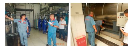
水运行岗位比武 (笔试、锅炉运行、太阳能运行、中水运行、无负压机房运行)

供了展示自我的平台，还提供了一次难得的学习交流机会。参加的所有工程技术部员工们互相观摩、互相比武，达到“以比促学、以比促能”的效果。提升自己，服务师生，维护“平安校园”和“和谐校园”是本次技能比武的最终目的。