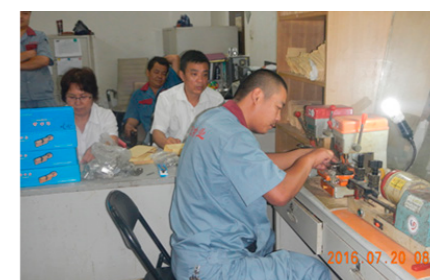
综合维修岗位比武 (镀锌管套扣、接水管、配钥匙、安装门锁、抹墙)