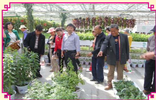
员工交流盆景移栽种植技术

整个参观给员工们留下了深刻印象。员工们纷纷感慨：“今天来参观真是大开眼界，没想到我们平时常见的农产品可以和这样的高科技联系起来，增长了很多知识”，“通过这次参观，更加体会到了‘科技就是力量’和‘科技改变生活’的含义”，特别是公司绿化专业人员感慨：“通过这次参观，我们不但亲近了自然，丰富了现代的农业技术知识，而且还打开了我们的创新思路”。纷纷表示，回校后要把本次参观考察带来的启发，在创新开展校园环境建设、创新绿化美化校园上大胆打开思路。此行真是获益匪浅，为昌欣物业未来对于校园环境规划，甚至对外商业环境规划奠定了理论基础和实践依据。