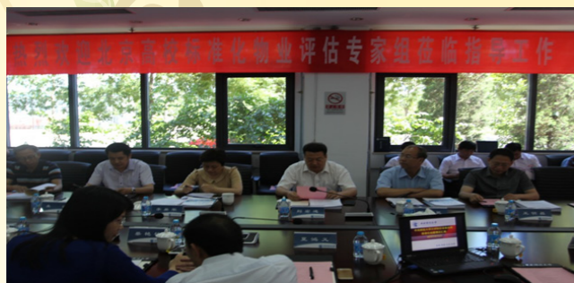
我校沙河校区设备设施运行标准化评估验收会场

2015年6月2日上午，我校沙河校区以94分的优异成绩顺利通过北京市高校设备设施运行标准化评估验收，成为北京市94所高校中第6所设备设施运行标准化达标院校。