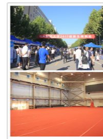
龙马路报到场地和迎新体育馆备用场地布置

动中心设置提前到校新生临时报到处，昌欣物业承接此服务，积极配合学校要求，设计提前报到处场地布置场景，自9月4日下午起进行提前报到处19个桌子，60把椅子的准备工作和19个学院牌的悬挂工作。9月6日下午开始做好龙马路50余个帐篷，