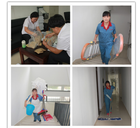
新生钥匙配备、物品配备和八号楼开荒保洁

做好宿舍开荒保洁和清理、物品配备和交接，打造宜居标准化宿舍。今年学生宿舍八号楼启用，在装修结束后，物业在9月1日起立刻调配东、西区楼内保洁员投入到新宿舍楼的开荒保洁