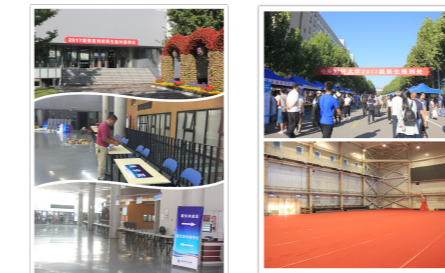
提前报到新生临时接待站场地布置

有条不紊，及时高效布置迎新场地。今年，为给提前到校的新生提供便利，学校在大学生生活