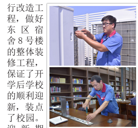
工程人员维修工作

坚守工程岗位，确保安全迎新。为保障迎新及开学后校园设备设施的安全运行，公司工程技术人员坚守岗位，放弃暑期轮休，奋斗在运行、综合维修、电工各岗位，合理有效安排各项设备维护保养时间，在迎新前完成了各项水、电设备的维护，配合教学技术服务中心对教室内教学设备进