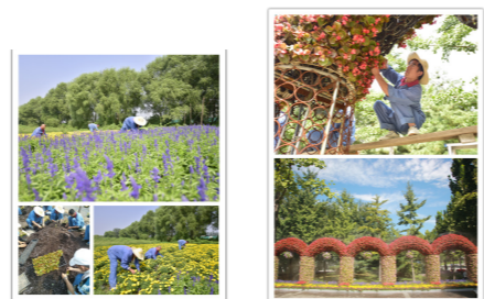
暑期迎新花卉培育