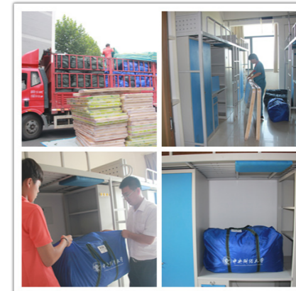
网络预订新生宿舍床上用品

面对大批新生集中入校报到，如何忙而不乱，细致有序地做好迎新服务准备工作，为学校分担迎新任务，为新生和家长提供贴心温暖的物业服务成为首要工作。为此，昌欣物业上下高度重视，在学校暑期到来之前召开迎新动员会，提前制定各项工作计划，完善应急预案；8月30日迎新到来前再次召开专题会议，全方位组织各项工作，全身心服务全体新生，吹响迎新集结号，进