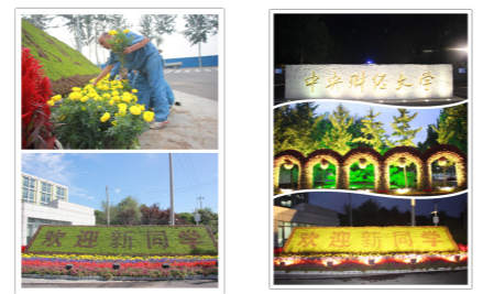
迎新主花卉之一——拱形花门