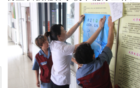
迎新期间节水宣传

倡导节能，配合学校营造节水型校园建设。迎新期间，昌欣物业积极配合学校节能办工作，