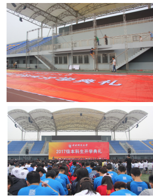
开学典礼主席台搭建

9月15日上午，我校2017级本科新生开学典礼在沙河校区体育场隆重举行。今年，学校全权委托昌欣物业承办开学典礼的会场布置、保洁服务及电力设备的维护等各项工作。公司上下高度重视，自迎新结束后就着手准备，分派任务，落实责任，确定布展方案。12日召开经理办公会议全面部署，确定了各项工作的具体负责人员，将所有相关工作细化到部门和具体责任人，并布置落实到位。9月14日下午15:00点前提前完成了所有相关布场工作。