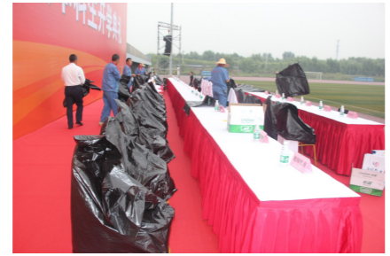
雨天遮挡主席台桌椅

为即将开始的开学典礼会场备好所需所有物品，做好最后准备。公司工作人员将提前制作的主席台台卡摆放到位，搬运并摆放好演讲台，摆放饮用水，搬运并摆放会场所需座椅，以崭新的姿态迎接开学典礼的到来。