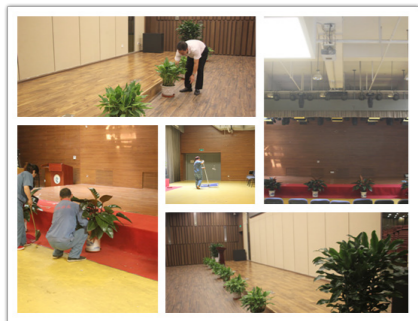
场地清理和绿植摆放

沙袋等物资的搬运工作，公司员工都以高标准的要求和一丝不苟的态度，配合学校完成各项工作。