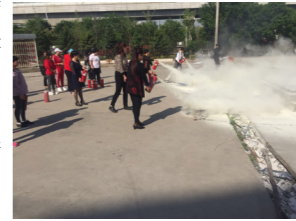
现场灭火技能实操培训

这次消防安全培训进一步提升了公司楼管员和保洁员的消防意识，强化了基本消防知识和火灾应急处置能力，为学校的发展和广大师生的生活提供了一个安全的环境。公司作为学校的服务保障部门，将始终把消防及安全管理列为重中之重，维护校园安全建设成果。