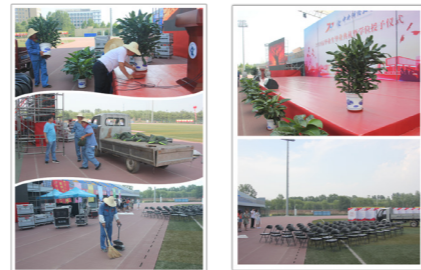
场地保洁、绿植装点和沙袋搬运工作

期间，公司资产管理及做好物品出入库工作，保障桌椅等学校所需物资的配备；学生宿舍楼管们在21日早5:00开放楼门，方便同学们出入；丁香园招待所协调房间、安排住宿，配合整体后勤保障工作的进行。全体员工满怀“真诚、善意、精致”的服务理念，倾力为毕业生们再一次提供周到的服务，配合学校圆满完成沙河校区首次毕业典礼。