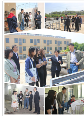
课程调研组参观污水处理厂、中水机房，查看学校节能监测平台

于污水处理原理、水质净化程序、所涉及参数和污水处理量等内容的讲解，了解关于污水处理设备改造的相关事宜。面对学院师生的咨询和交流，昌