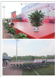
田径运动会场场图

典礼结束后，公司员工及时并有序完成会场内物资撤场，进行清理和保洁，保证毕业典礼有一个完美的收尾。