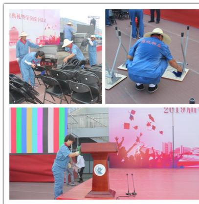
擦拭并摆放演讲台和桌椅

后的布置和检查工作，在学校工作人员指导下，物业师傅们争分夺秒，搬运演讲台、摆放桌椅，用绿植装点会场，保证在同学们6:00入场前提供一个整洁的环境氛围。毕业典礼期间，工程师们严阵以待，时刻保障电力供应和设备正常运行。