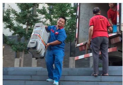
接收并存放邮局和铁路托运的新生行李

新生行李关系到新同学们入校便利生活的顺利展开,是历年昌欣物业关注的一个重要方面,今年也不例外。暑期,昌欣物业安排专职人员,及时与沙河邮局、北京站、北京西站、中铁快运(北京配送中心)小屯货场等物流货运转站取得联系,签订行李托运协议;放弃轮休时间,多次劳碌奔波于各车站,为新生提取行李2300多件,并按学院分别安置于大学生活动中心地下阅览室。今年,由于部分新生错误使用快递方式发送了行李,尽管往年物业公司并不负责代收快递行李,但