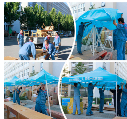
搬运桌椅、搭建迎新帐篷

昌欣物业积极配合学校宣传部制作迎新空飘、条幅,保证这些装饰物品在迎新前一天准备到位,并在迎新前完成布置装点工作。