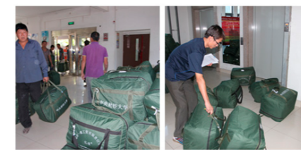
为新生配送网络预订的床上用品至宿舍

为了给新同学们提供一个温馨、安全的宜居宿舍环境，客服部员工们对新生居住的房间进行了保洁清理和物品配备，进行钥匙的试开和分装工作，并做好住宿登记卡及住宿协议的准备工作。迎新期间，各楼管员们严守宿舍大门，一一核对进楼人员，