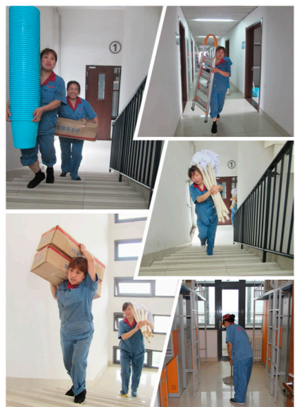
为新生宿舍配备日常用品