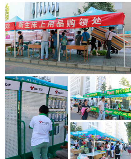
迎新卖场人来人往

为便利新生在迎新期间购买宿舍及生活用品,昌欣物业提前于暑期考察多个商家,选择有质量保证的商家入校进行迎新生活用品驻场销售服务。在本科生和研究生迎新期间设立校内迎新实体大卖场,在物业的监管下为新生提供商品销售服务,“一站式”