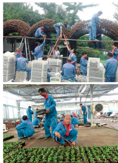
“拱形花门”搭建和迎新花卉栽培

为了使校园以最美的姿态在早秋中迎接各地学子的到来,环境部外围保洁克服人少、保洁面积大的困难,于新生报到前夕打响了“迎新保卫战”,将校园各道路进行清理、保洁,赋予年轻的沙河校园以清新的姿态。