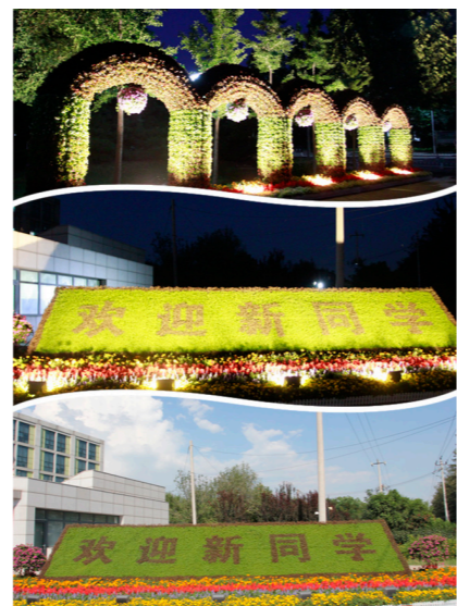
夜景、白天的迎新花卉