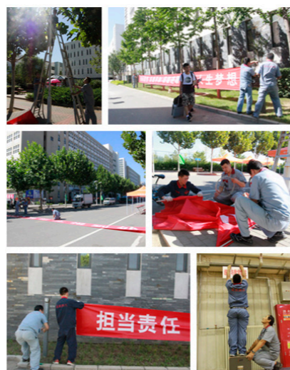
悬挂条幅和备用场地学院牌