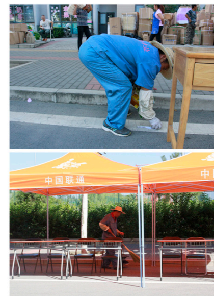
收拾垃圾的物业员工