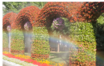
彩虹映衬下的幻彩“拱形花门”