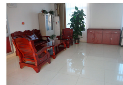
招待所体贴备至的迎新服务

为了在新生到来时为家长们提供一个便捷的住宿条件,丁香园招待所自暑期就开始了忙忙碌碌的准备工作。从打扫房间,清洗床上用品,清洗空调,安置防滑垫,到配备牙具和洗浴用品,样样周到细致,确保给新生家长提供一份宾至如归的亲切体验。