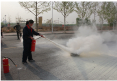
物业员工练习灭火器使用

隐患、扑救初期火灾、组织人员疏散和开展宣传教育。此次培训既让学生宿舍一线服务员们认识到了宿舍火灾的严重性，初期火灾扑救的重要性，又使员工们掌握了消防灭火器材的正确使用，增强了实际操作的能力，强化了员工们的防火安全意识和应急处置能力，为全面做好平安校园维护工作，响应北京市教委关于公寓标准化建设的要求起到了积极作用。