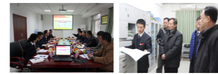
验收事项等方面内容进行了深入探讨和实地查看。