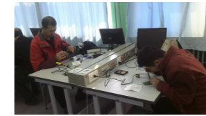
电子线路板实操焊接

天，分为理论考试和四项实操科目考试。培训和比赛时间紧、任务重，员工们既有比赛的压力，又在与其他单位员工的交流中获得前进的动力，顺利完成了各项任务。